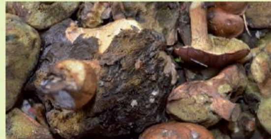
Vergammelte Maronierpilze - „Wollen Sie so etwas wirklich essen?“

Leider sind nicht alle Sammler so einsichtig und beharren darauf, ihre Funde auch zu verzehren. Das kann aus mehreren Gründen gefährlich werden.