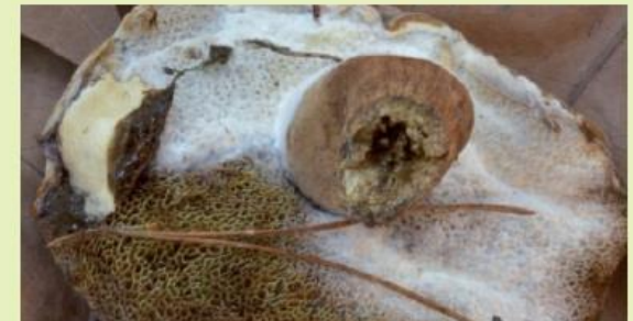
Schimmelbefall bei Maronierpilzen (fortgeschrittenes Stadium)