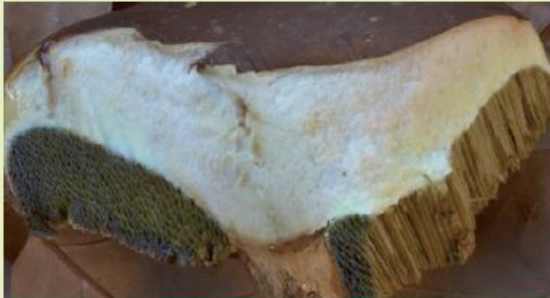
Eiweißzersetzung im Hutfleisch

Von außen nicht erkennbar ist die Eiweißzersetzung des Pilzfleisches. Dabei entstehen Stoffe, die gesundheitsschädlich sein können. Vor allem bei Röhrlingen achte man auf farbliche Veränderungen im Hutfleisch, die oft nur andeutungsweise erkennbar sind. Bevor Sie einen Pilz abschneiden, drücken Sie mit dem Finger auf die Hutoberfläche. Sie muss sich fest anfühlen. Lässt sich ohne nennenswerten Kraftaufwand eine Delle hineindrücken, ist der Pilz für Speisezwecke nicht mehr geeignet. Meist ist er auch schon von Maden befallen. Lassen Sie ihn stehen – er kann immer noch seine Sporen freisetzen und so zum Erhalt seiner Art beitragen.