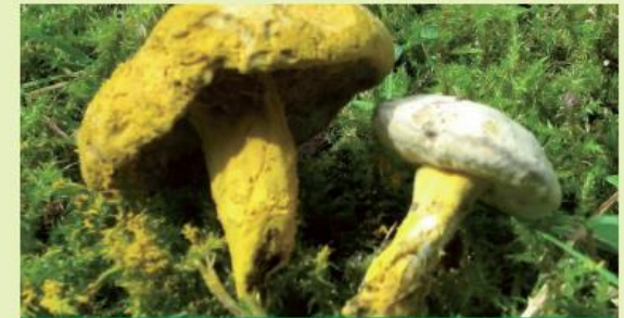
Goldschimmelbefall an Rotfußröhrlingen (Endstadium)

Beim häufigen Goldschimmel beginnt es mit kleinen grauen Flecken, die schnell größer werden und bald als weißer, im Endstadium goldgelber Belag den ganzen Fruchtkörper überziehen (s. Abbildung oben).