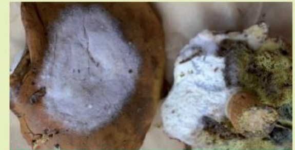
Schimmelbefall bei Maronierpilzen (frühes Stadium)

Wir kennen es aus der Küche. Auch Brot kann von Schimmel befallen werden, oft schon wenige Tage nach dem Kauf. Wir wissen, dass es nicht mehr gegessen werden darf. Es genügt nicht, betroffene Stellen auszuschneiden. Genauso ist es bei Pilzen.