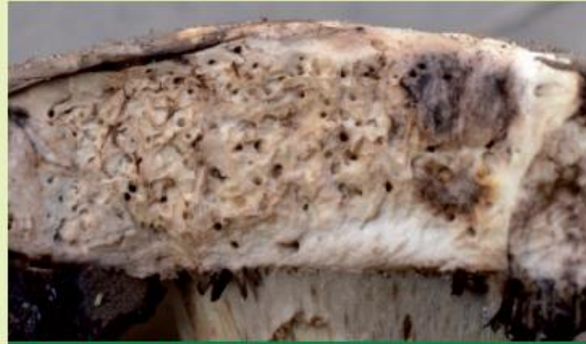
Madenbefall bei einem Steinpilz

Stellen Sie grundsätzlich an selbst gesammelte Pilze die gleichen Qualitätsansprüche, die Sie beim Kauf von Obst und Gemüse im Supermarkt stellen würden!